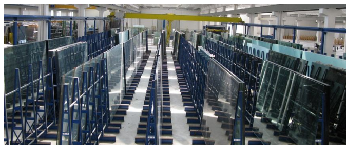
Sede produttiva Predari Vetri S.p.A

La visita allo stabilimento Pellini S.p.A. ripercorre i diversi prodotti sviluppati dall'azienda, dai sistemi a veneziana integrati, alle tende per interni ed a rullo e plissé, compreso la camera climatica con il sole artificiale per effettuare i test di prodotto. Mentre quello delle Vetrerie Cappelletti e Roleri e Predari Vetri ripercorre passo a passo la produzione dei vetrocamera con particolare attenzione al vetro tenda.