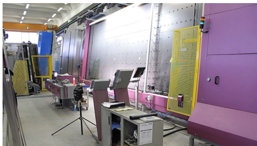
Sede Produttiva Vetreria Cappelletti & Roleri

E' in questo ambito che le aziende hanno deciso di aprire il loro stabilimento produttivo ai professionisti architetti, ingegneri e tecnici geometri e periti in modo da far conoscere di persona la complessa e lunga filiera in grado di assicurare agli utenti finali prodotti sempre più all'avanguardia, frutto di continui studi e ricerche insieme a istituti di ricerca nazionali ed europei. Una opportunità unica per poter toccare con mano e conoscere il lavoro che c'è dietro una innovazione di prodotto.